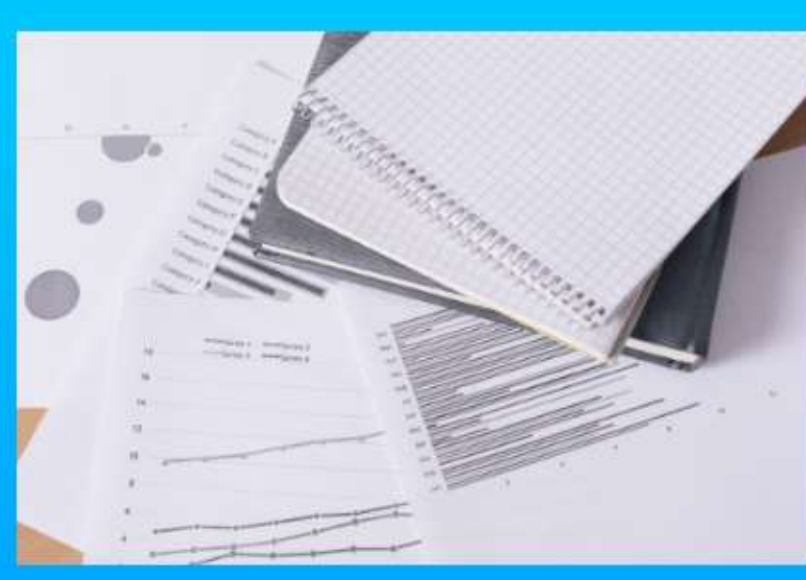
ドキュメント作成支援